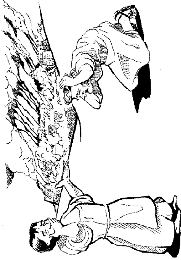
बाबुल का गिरना ( 18:9-19)