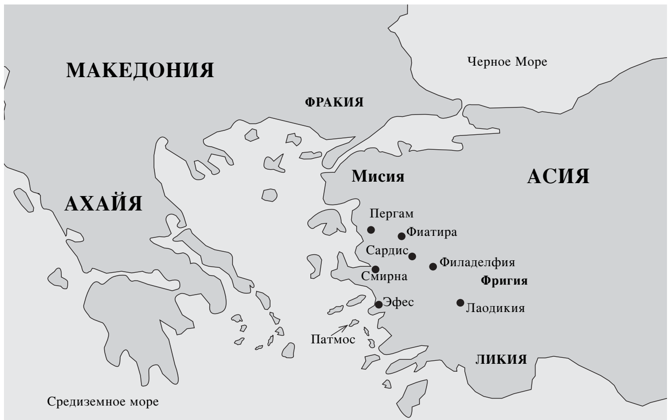
Семь церквей Азии и остров Патмос

“Словом «изгладить» [«стереть»; СП] переведено греческое εξκαλειφο . Его употребление в 3:5 ярко контрастирует с 7:17 и 21:4, где оно переводится как «отирать»: «И отрет Бог вся-