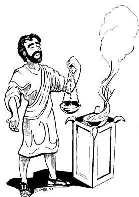
Ангел перед жертвенником курения (8:4)

И пришел иной ангел и стал пред жертвенником, держа золотую кадильницу; и дано было ему 10 множество фимиама, 11 чтобы он с молитвами всех святых 12