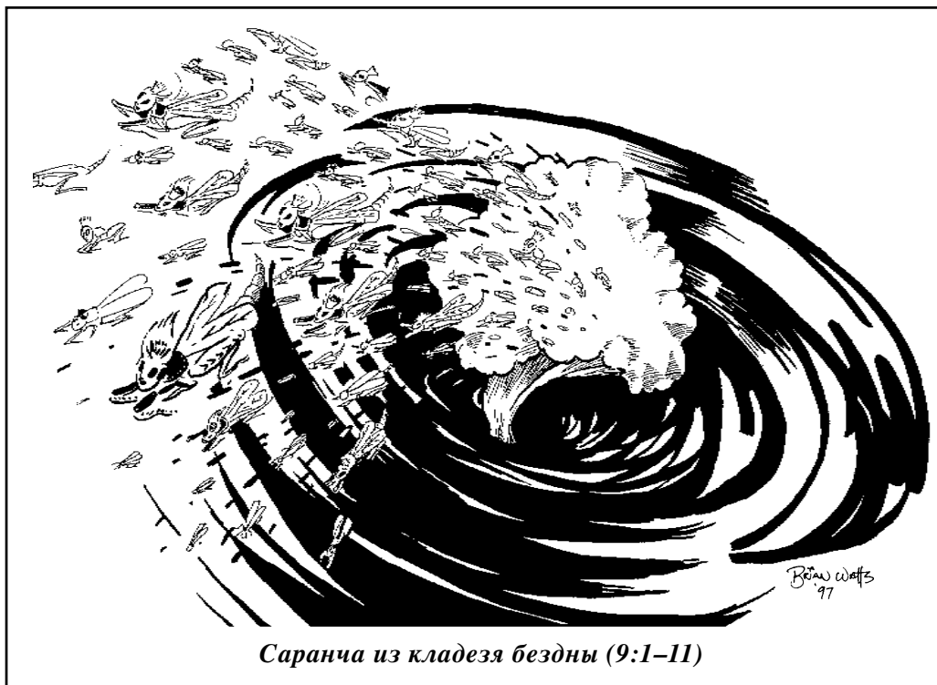
Саранча из кладезя бездны (9:1–11)

Читатели Иоанна, наверняка, связали бы это с римскими властями, которые организовывали гонения на них, и я уверен, что неверующие Римской империи возглавляли список грешников, составленный Святым Духом, когда записывалось Отк. 9:1–11. Р. Саммерс пред-