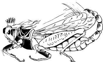
Саранча из видения (9:3, 7)