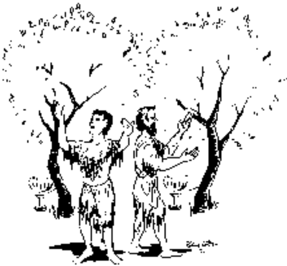
Два пророчествующих свидетеля (11:3)

Голос продолжал: “И они будут пророчествовать тысячу двести шестьдесят дней” 4 (ст. 3б, в). Мы уже говорили о символическом числе “тысяча двести шестьдесят дней” в предыдущем уроке. Это то же самое, что сорок два месяца или три с половиной года. Мы отмечали, что в Откровении число “три с половиной” (половина семи) ассоциируется с переживаниями, трудностями и испытаниями – и подразумеваемой надеждой на завтра. 5 Однако сейчас нас больше интересует тот факт, что продолжительность времени, в течение которого пророчествовали свидетели, равняется тому периоду, в течение которого язычники попирали двор и город (11:2). В трудные времена Бог не прятал свой народ; Он посылал Своих свидетелей.