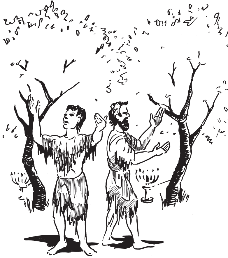
இரண்டு சாட்சிகள் (11:3)