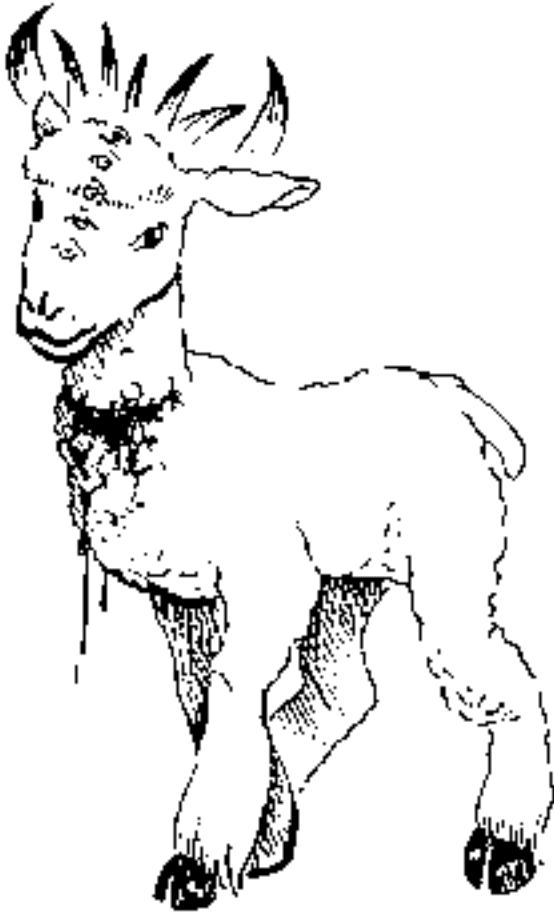
കുഞ്ഞാട് നിൽക്കുന്നു (5:6)