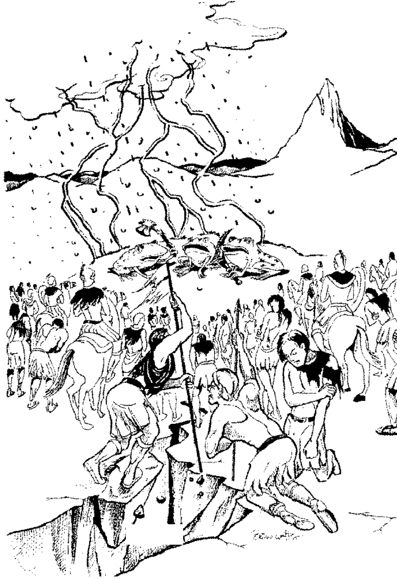
सातवां कटोरा (16:17-21)