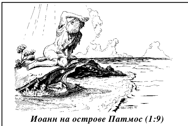
Иоанн на острове Патмос (1:9)

В первый день недели Иоанн поднялся рано, впрочем, как и все последние шестьдесят лет. Когда взошло солнце, он уже сидел на берегу на большом валуне лицом на восток и вглядывался в синюю морскую даль. Брызги от разбивающихся о прибрежные камни волн достигали его лица, но мыслями он был далеко от моря – там, где его братья в этот час собирались на богослужение. Он представил себе любимые лица, и на глаза навернулись слезы. Вот они молятся, преломляют хлеб, поют. И тогда он из своего далека возвысил свой надтреснутый старческий голос и с большим чувством воскликнул: “Ему, соделавшему нас царями и священниками Богу и Отцу Своему, слава и держава во веки веков!” (ст. 6).