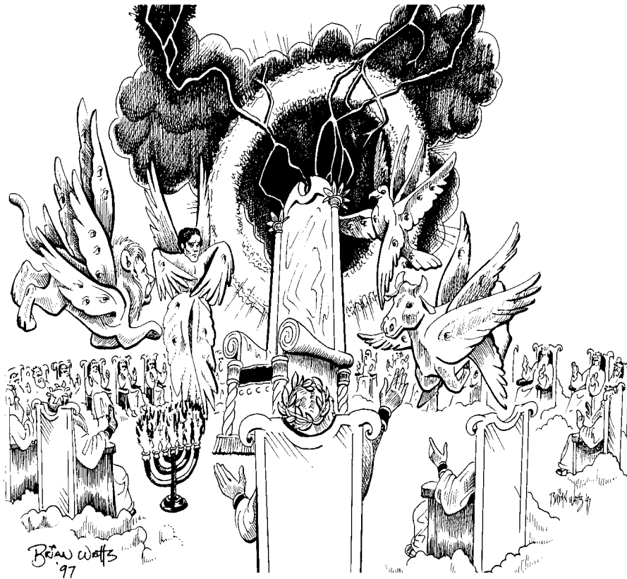
Сцена вокруг престола (4:2–8)

главное. Эта сцена дана для того, чтобы ослепить своим великолепием и взволновать воображение. Ее предназначение – поразить нас величием Бога!