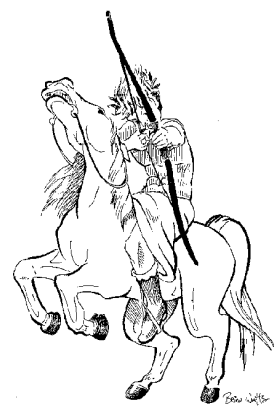
Первый всадник (6:1, 2)

Представляется, что контекст говорит в пользу той точки зрения, что первого всадника следует рассматривать в неразрывной связи с другими тремя – как существенную часть разрушительных сил, выпущенных на землю. Подумайте вот о чем: все четыре всадника выводятся на сцену одинаково, четверым существами. (Перед вскрытием других печатей четыре существа не говорят никаких вводных слов).