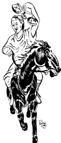
Третий всадник (6:5)

И когда Он снял третью печать, я слышал третье животное, говорящее: иди и смотри. Я взглянул, и вот, конь вороной, 19 и на нем всадник, имеющий меру в руке своей. И слышал я голос посреди четырех животных, говорящий: хиникс 20 пшеницы за динарий, и три хиникса ячменя за динарий; 21 елея же и вина не повреждай (ст. 5, 6).