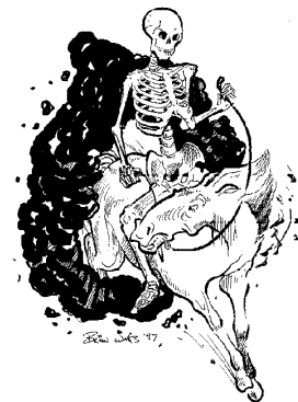
Четвертый всадник (6:7, 8)

Вероятно, имеет значение тот факт, что это все те же четыре агента смерти, которых Бог использовал и для наказания Иерусалима за его грех. В