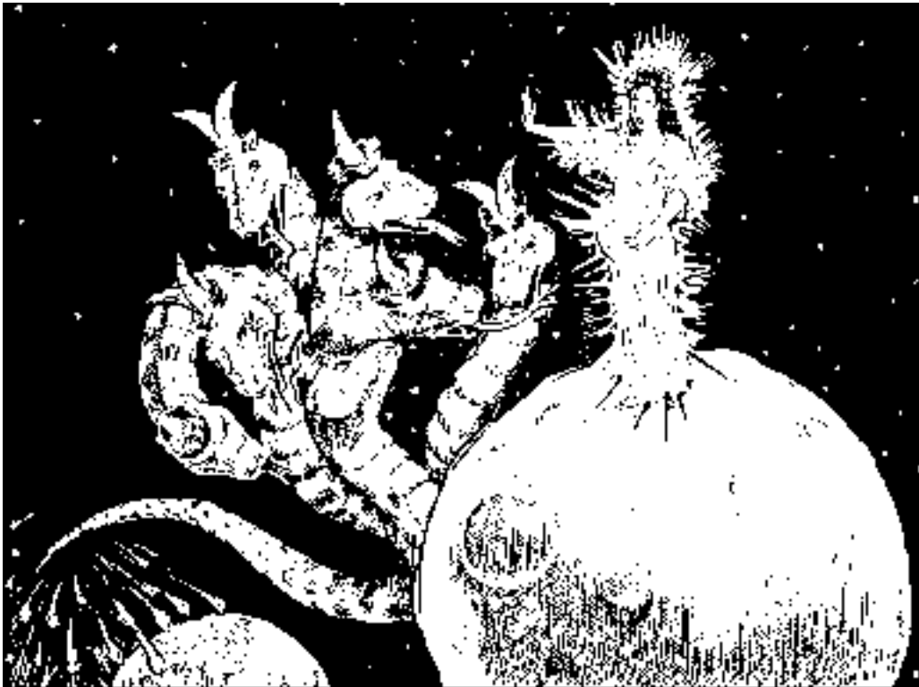
Женщина и дракон (12:1–4)

Иоанна в женщине видели церковь” (Квиспел). Однако такое отождествление, похоже, вступает в противоречие с первыми пятью стихами главы, которые говорят о рождении женщиной Иисуса: ведь мы знаем, что это Иисус дал жизнь церкви, а не церковь – Иисусу (Мат. 16:18, 19).