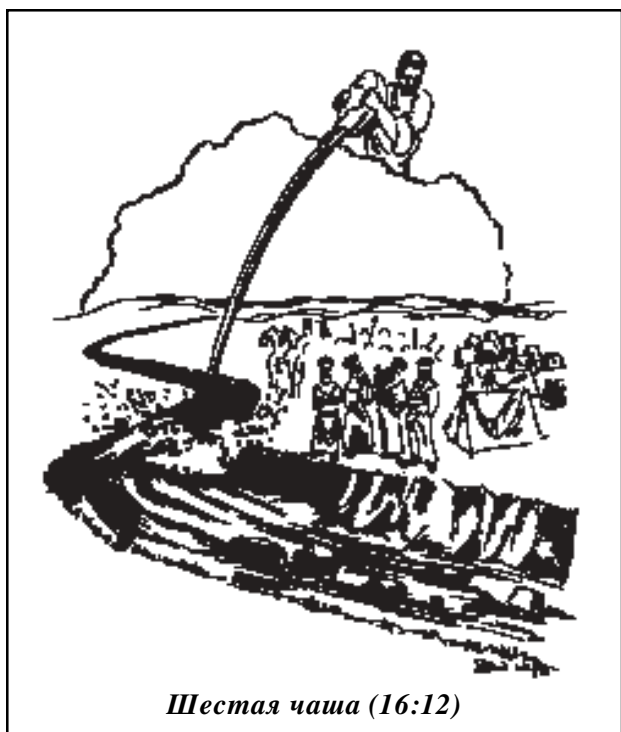
Шестая чаша (16:12)

И видел я выходящих из уст дракона и из уст зверя и из уст лжепророка 14 трех духов нечистых, 15 подобных жабам: это бесовские духи, творящие знамения; они выходят к царям земли всей вселенной, чтобы собрать их на брань в оный великий