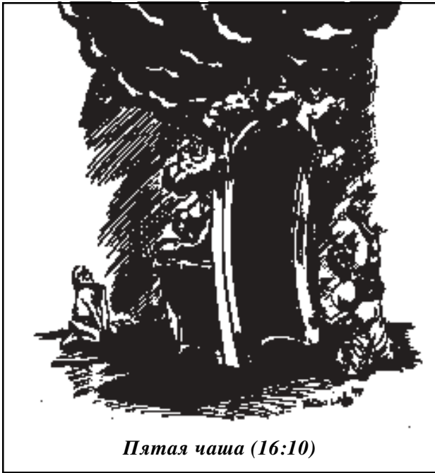
Пятая чаша (16:10)

общество в целом и даже Бога – всех и вся, но только не себя. 1 Тем не менее, Библия учит, что мы сами отвечаем за свои поступки: “Душа согрешающая, она умрет; сын не понесет вины отца и отец не понесет вины сына... и беззаконие беззаконного при нем и остается” (Иез. 18:20).