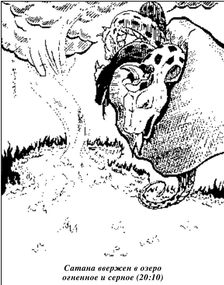
Сатана ввержен в озеро огненное и серное (20:10)

рует: “А была ли война-то? Бог сказал, и дело было сделано. Бог полностью расквитался со злом одним яростным ударом”. “Божья сила настолько сокрушительна, что, когда Он желает уничтожить врага, не может быть даже видимости битвы” (Моррис).