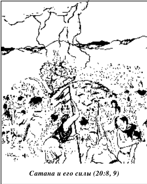
Сатана и его силы (20:8, 9)