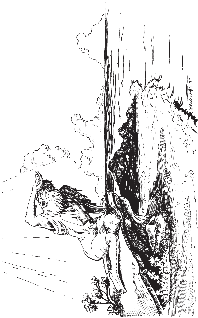
യോഹന്നാൻ പത്തൊമ്പതാം ദിവസം (1:9)