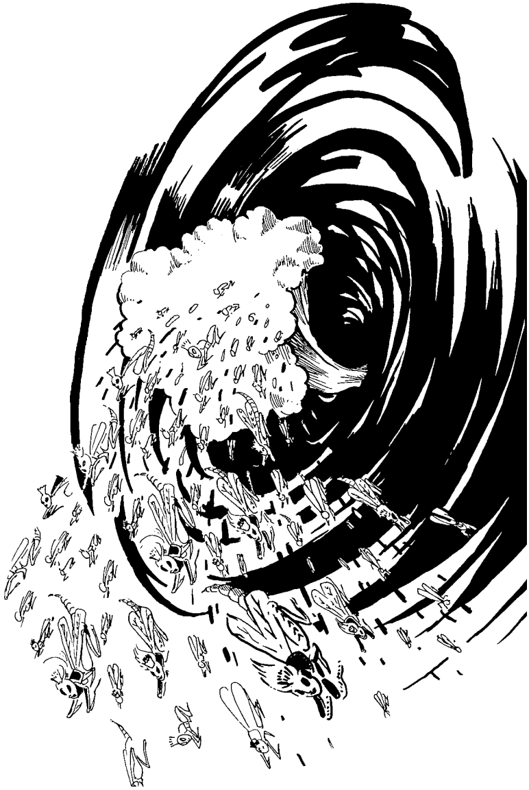
അഗാധകൃപത്തിൽനിന്നുള്ള വെട്ടുകിളികൾ (9:1-11)