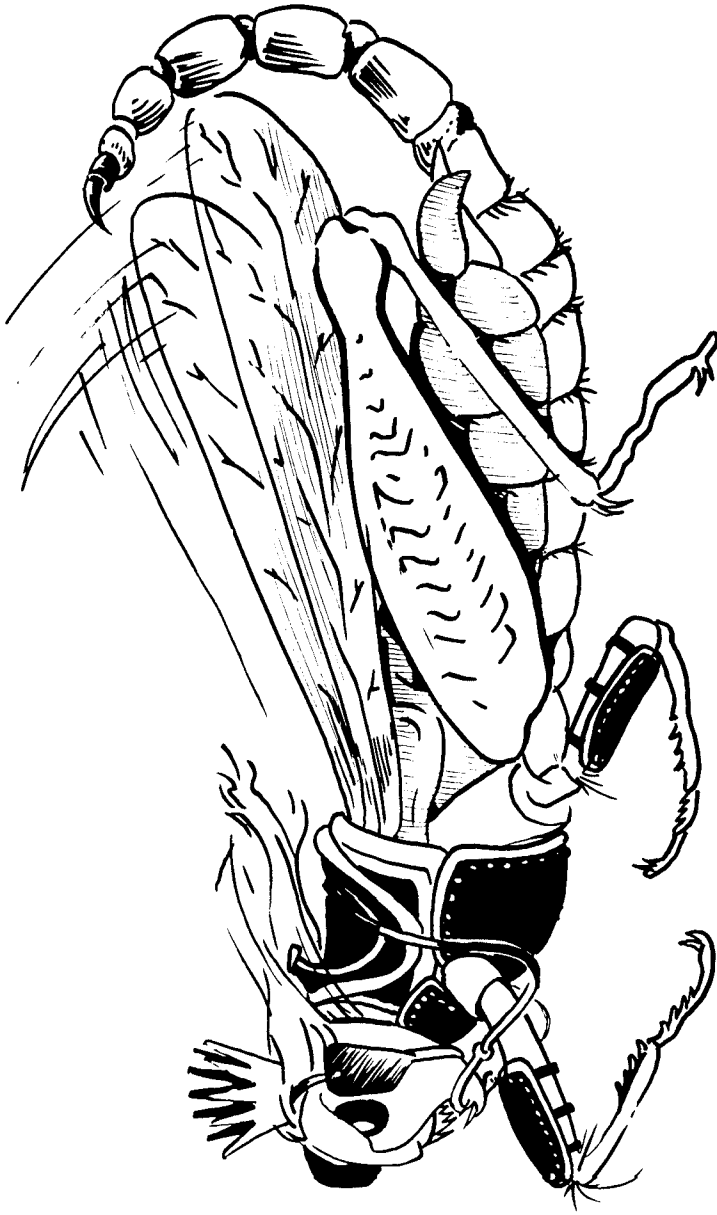
ദർശനത്തിൽനിന്നുള്ള ഒരു വെട്ടുകളി (9:7-10)