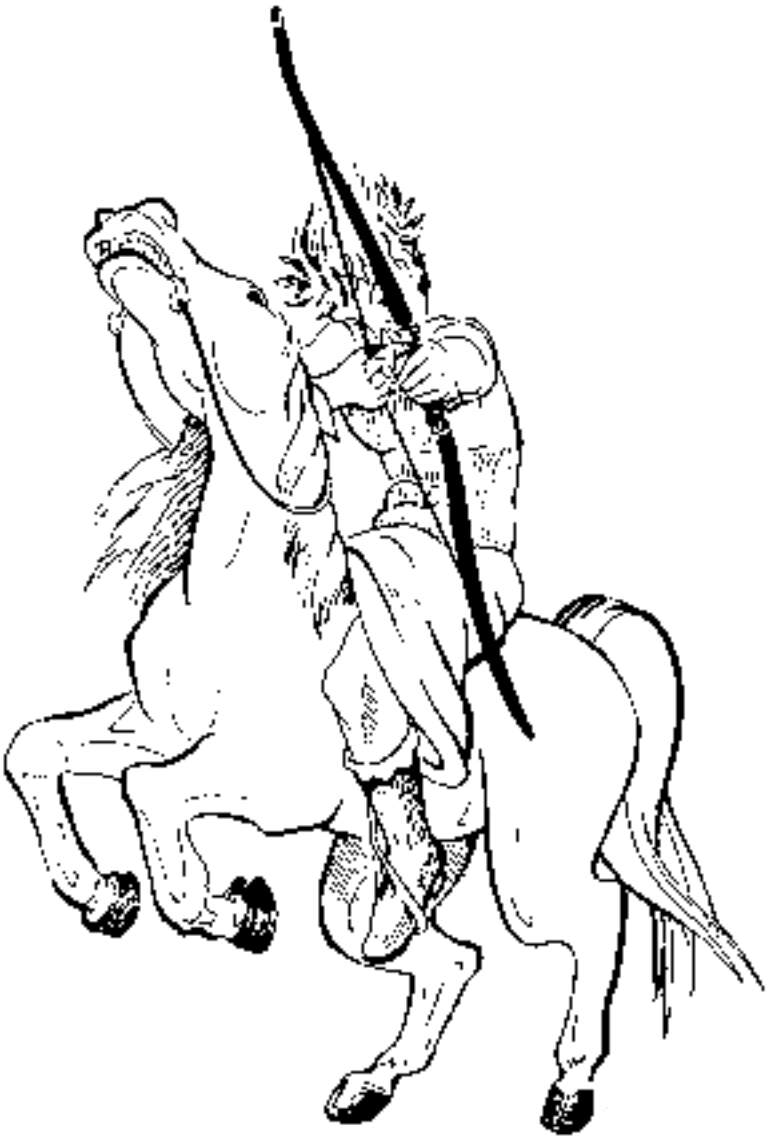
ഒന്നാം കുതിരക്കാരൻ (6:1, 2)