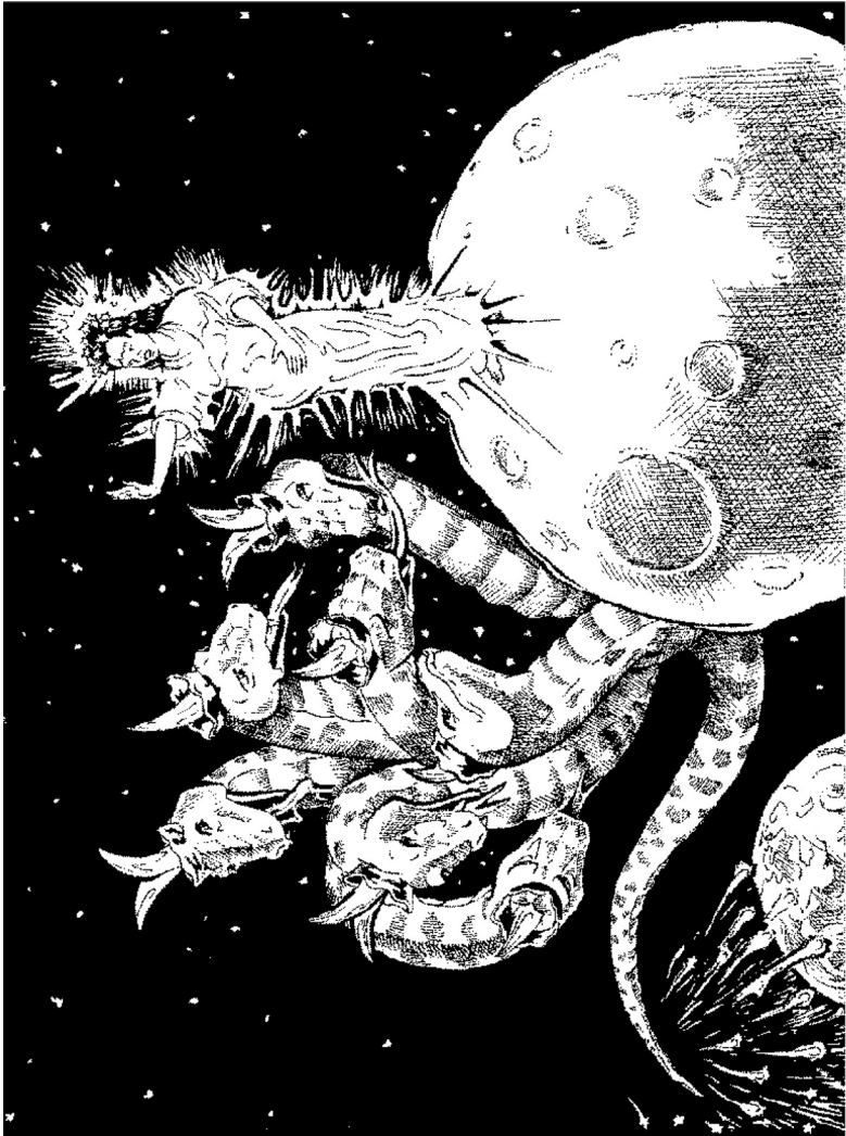
ചുവന്ന സർപ്പത്തിനെതിരായ സ്ത്രീയും കുട്ടിയും (12:1-4)