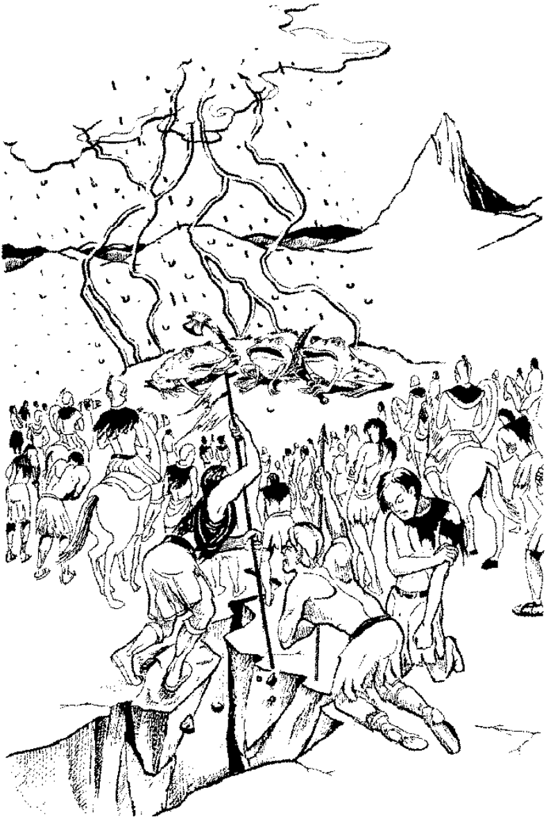
ഏഴാമത്തെ കലശം (16:17-21)