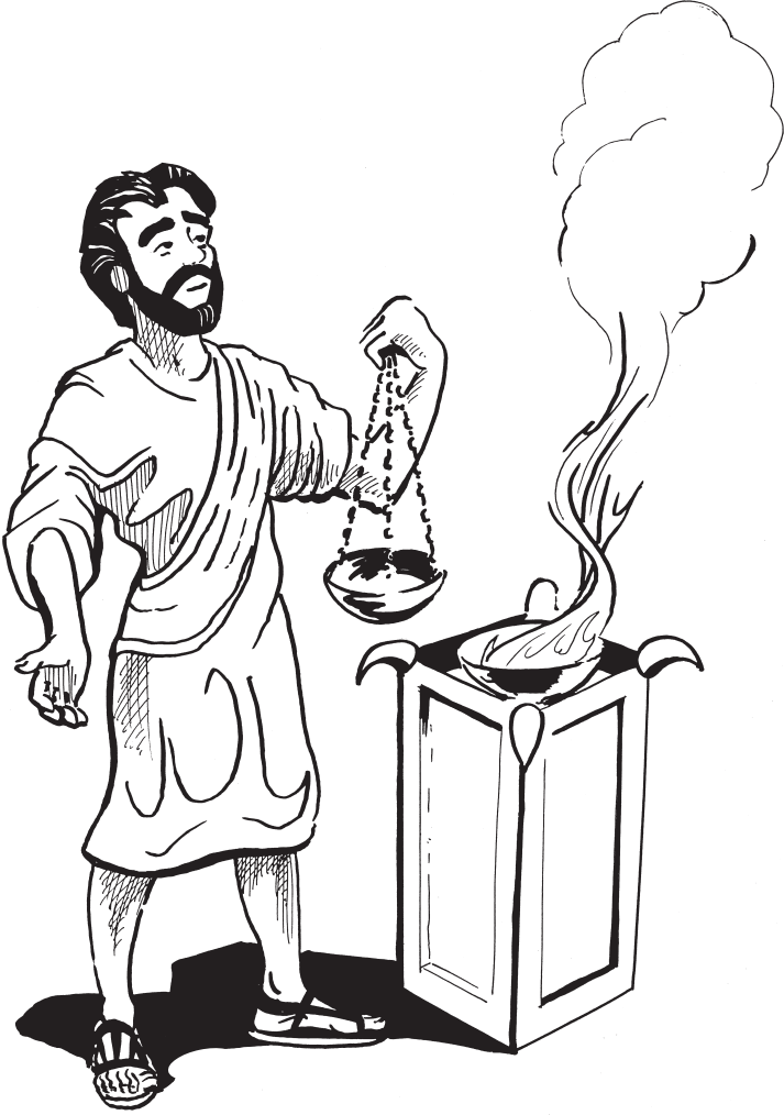
தூபத்தின் முன்பாக ஒரு தூதன் (8:4)