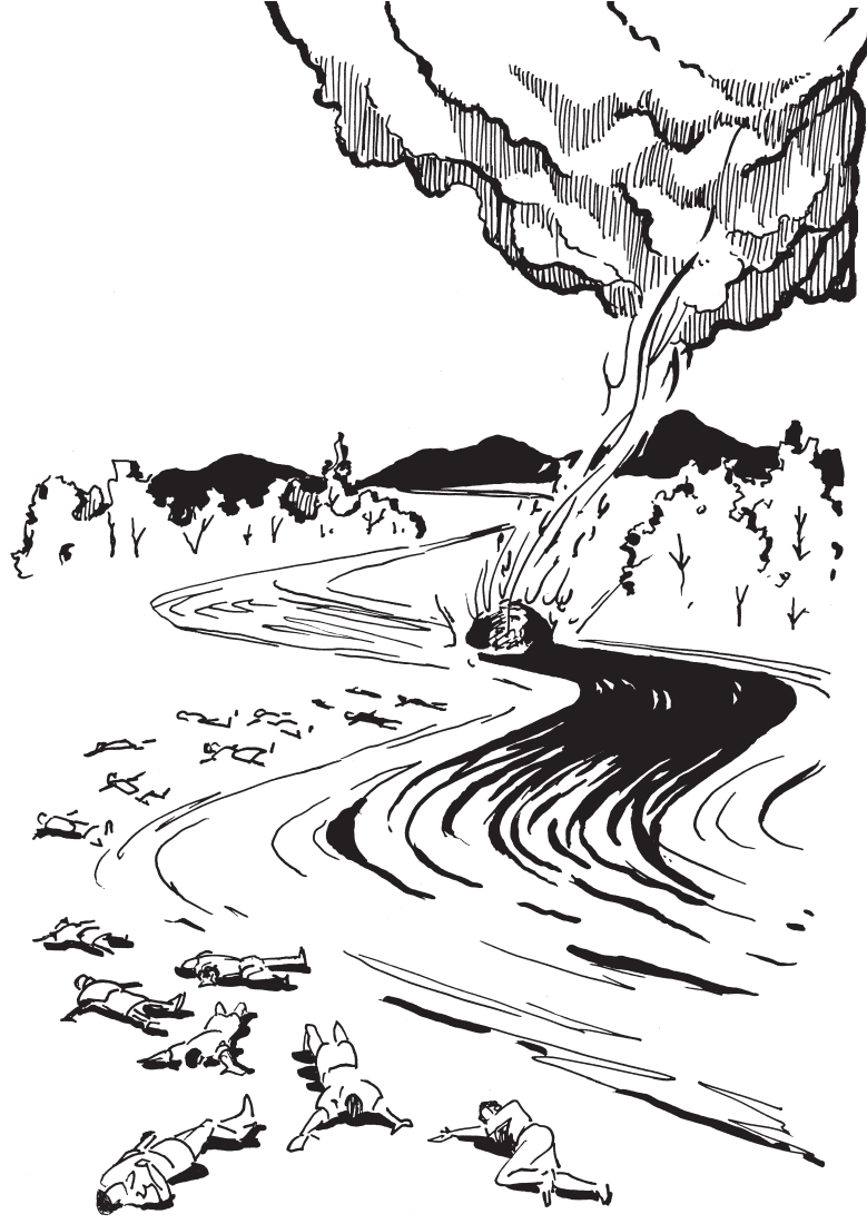
మూడవ బూర ఊదబడింది (8:10, 11)