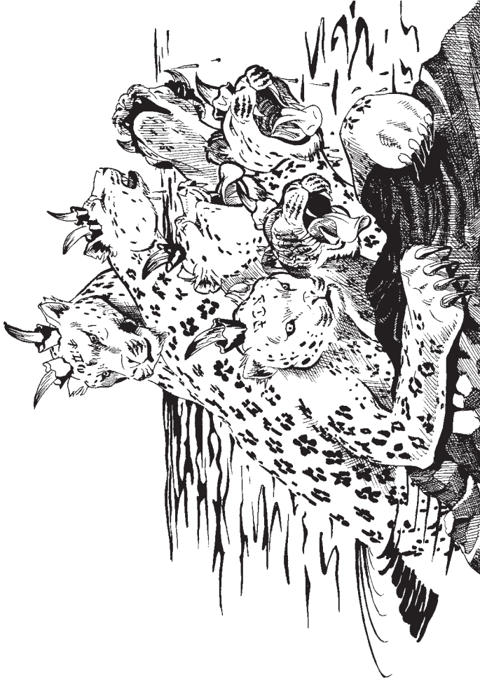
సముద్ర ప్పుగము (13:1, 2)