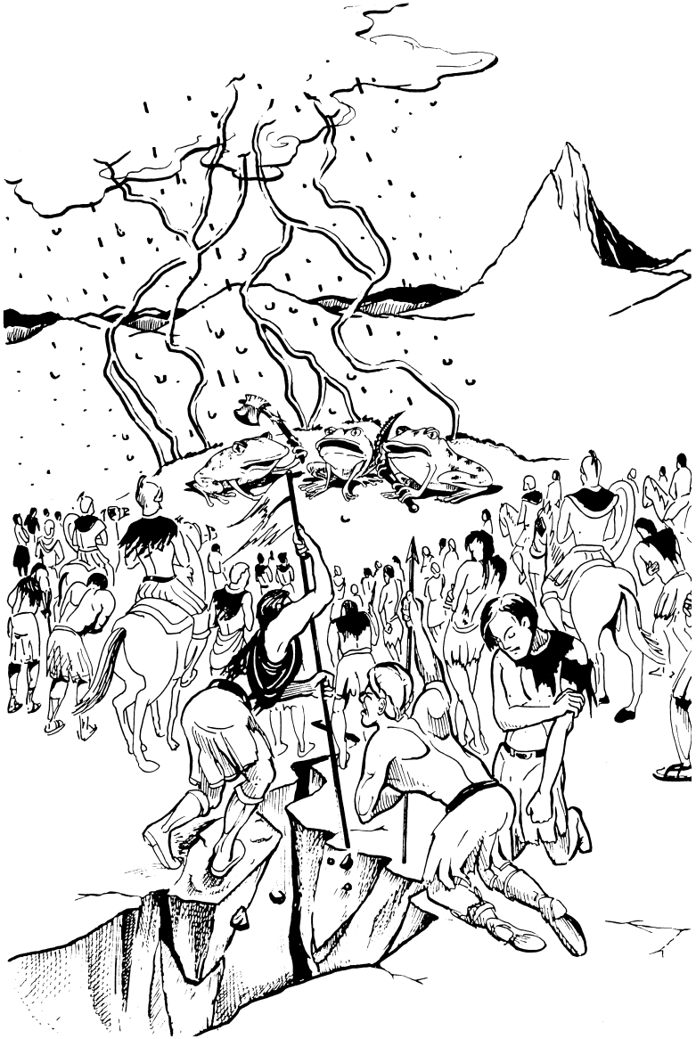
ஏழாம் கலசம் (16:17-21)