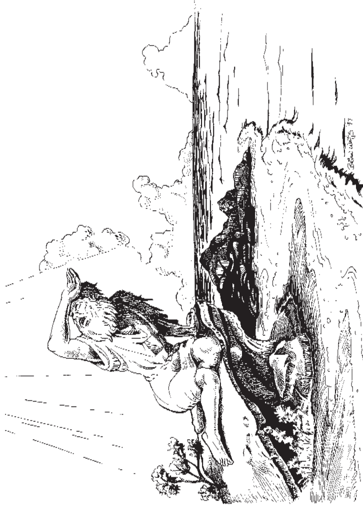
పత్మాను ద్వీపములో యోహాను (1:9)