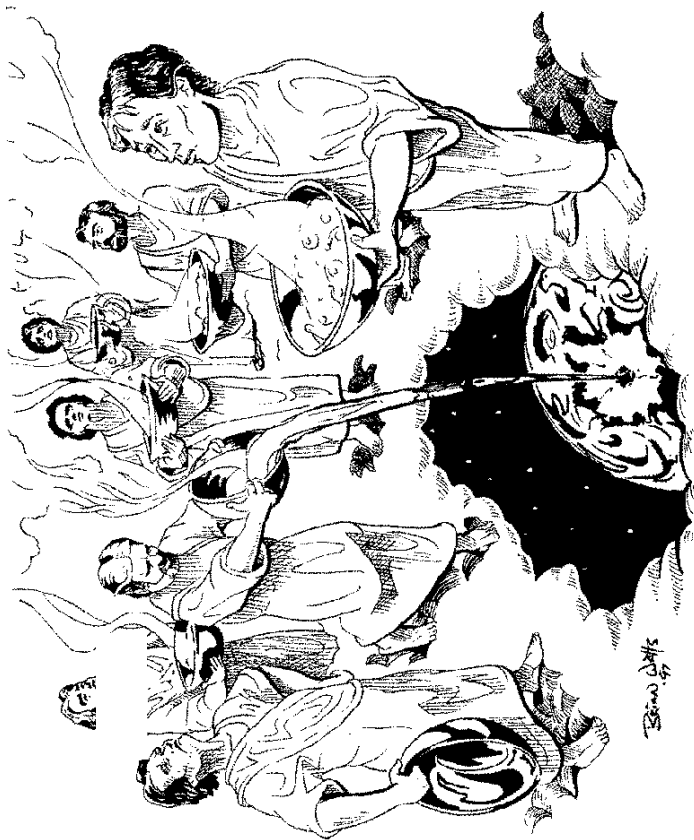
परमेश्वर के क्रोध के सोने के कटोरे उण्डलते हुए स्वर्गदूत (16:1)