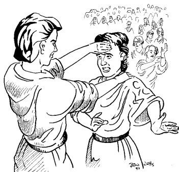
Ангел, запечатывающий Божьего раба (7:3)

Ключевое слово в тексте – “печать”: ангел с востока имел “печать Бога живого” (ст. 2). Он крикнул четырем ангелам, чтобы они “не дела[ли] вреда ни земле, ни морю, ни деревьям”, пока не будут положены “печати на челах рабов Бога...” (ст. 3). Мы читаем, что “запечатленных было сто сорок четыре тысячи из всех колен сынов Израилевых” (ст. 4). Далее перечисляются все двенадцать колен Израилевых и говорится, что из каждого рода “запечатлено двенадцать тысяч” (7:5–8).