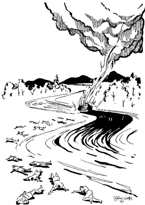
Звучит третья труба (8:10, 11)

звезда, которая упоминается в следующей главе и должна, следовательно, обозначать дьявола. 29 Однако эта звезда выполняет роль просто декорации; главное – как она повлияла на источники питьевой воды: “Имя сей звезде полынь; и третья часть вод сделалась полынью, и многие из людей умерли от вод, потому что они стали горьки”. 30