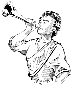
Трубящий ангел (8:2)

В невдохновенной иудейской апокалиптической литературе имеется рассказ о семи ар-