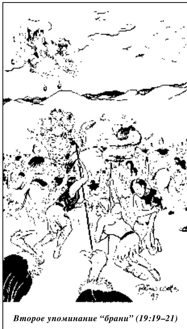
Второе упоминание “брани” (19:19–21)

Как мы отметили в предыдущем уроке, жабь собрали свое войско именно на том месте, где добиться победы для них было невозможно, где они были обречены с самого начала!