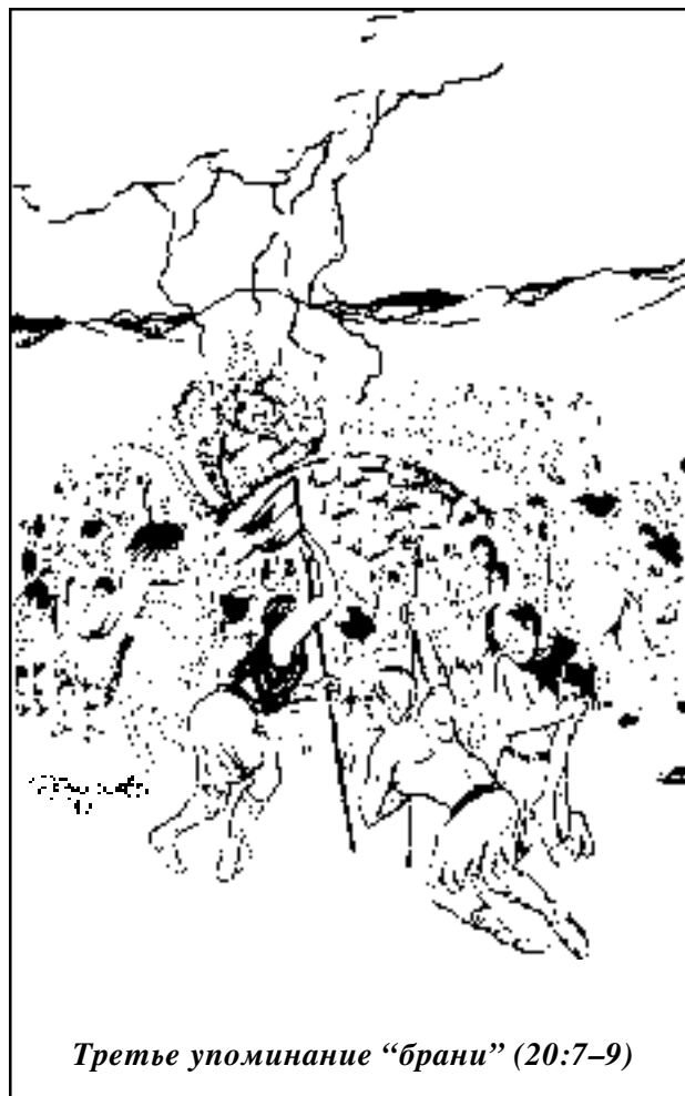
Третье упоминание “брани” (20:7–9)

Еще и еще раз повторяю: “Никакой битвы при Армагеддоне нет”. 20