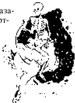
Четвертый всадник (6:8)

В следующем стихе сказано: “Тогда отдало море мертвых, бывших в нем, и смерть и ад 6 отдали мертвых, которые были в них” (ст. 13а). На протяжении всего Откровения смерть и ад связаны между собой (1:18; 6:8). “«Смерть» – общая судьба людей, ...а «ад» – их общее пристанище...”